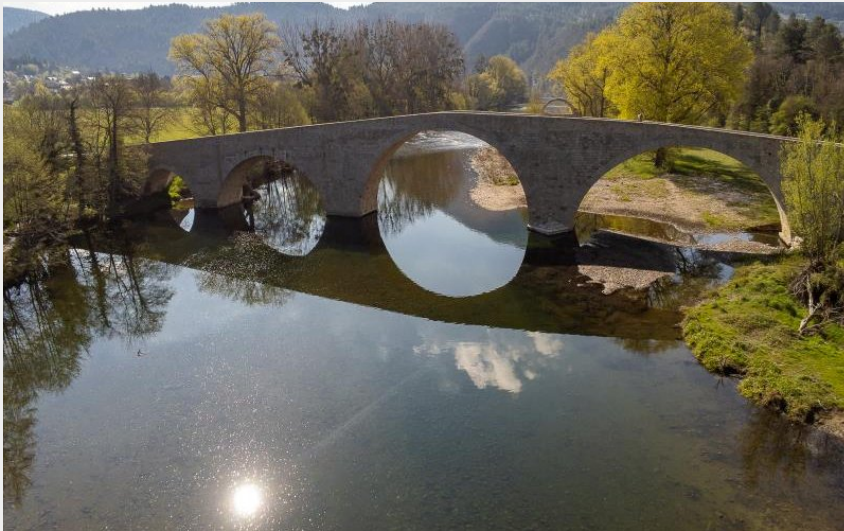
pont Quézac soleil couchant