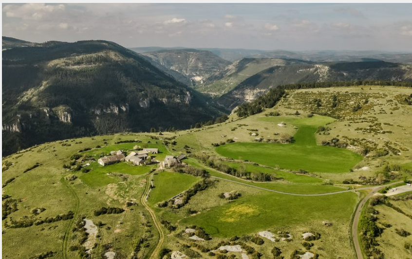
Causses et Gorges du Tarn- vu du ciel (DESMIERS)