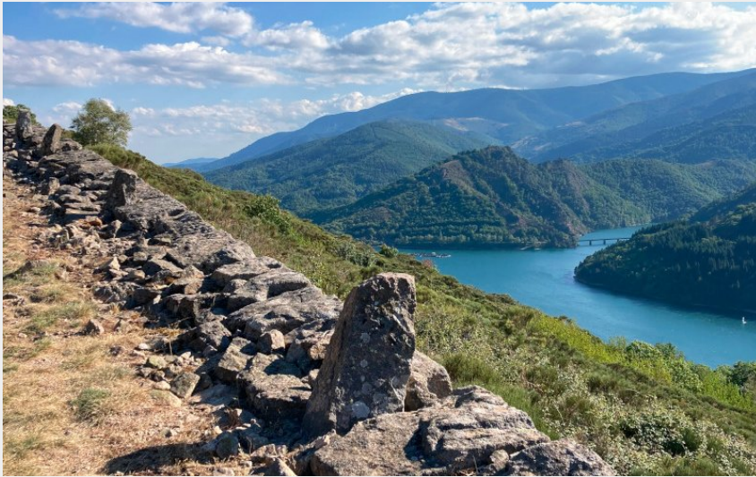
(Office de tourisme Mont Lozère)