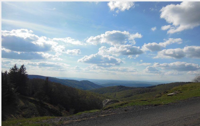
Vue au-dessus de Part-Peyrot (Béatrice Galzin)