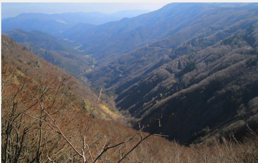
Le belvédère de la Serreyrède (Audrey Bourgade)