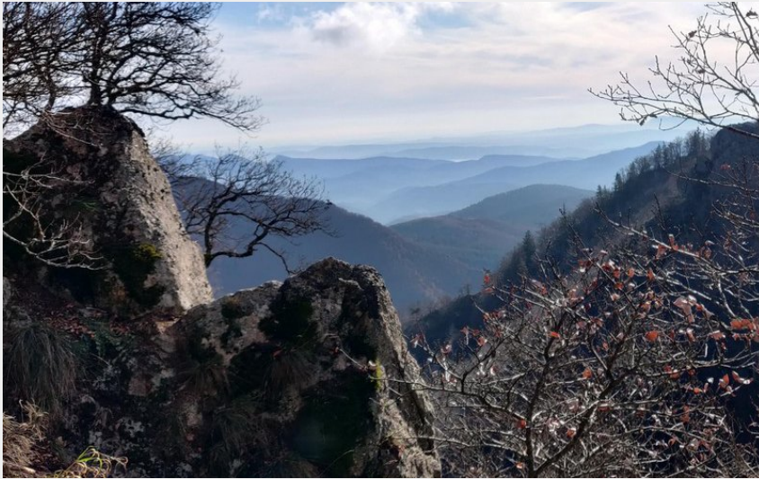
La vue des Cascade d'Orgon (Béatrice Galzin)