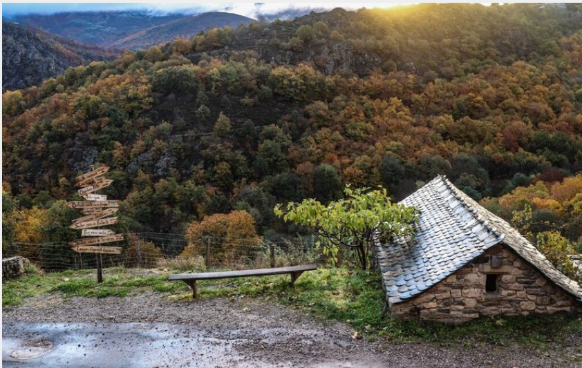
maison cévenole en pierres (de beaux lents demain)