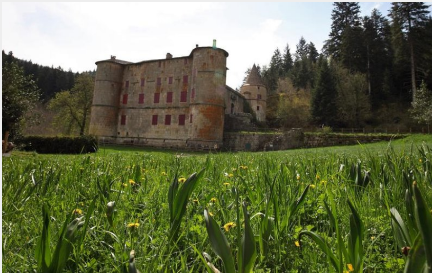
chateau de Roquedols