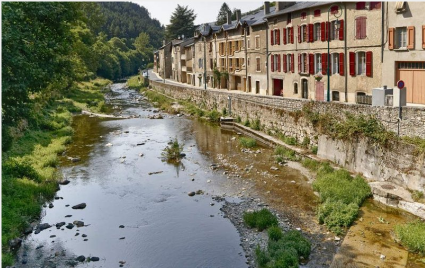
La Jonte à Meyrueis