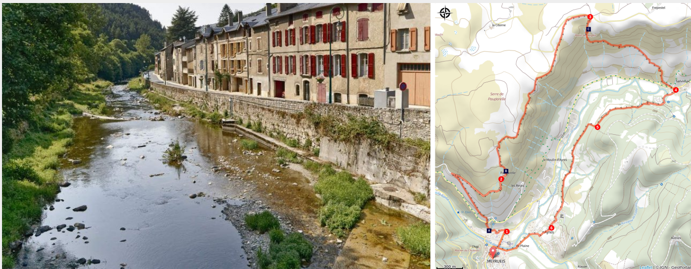
La Jonte à Meyrueis

Du plateau aride des causses au contrefort du puech Pouchut, cet itinéraire permet la découverte de la haute vallée de la Jonte, riche en contraste. Un voyage entre Causses et Cévennes.