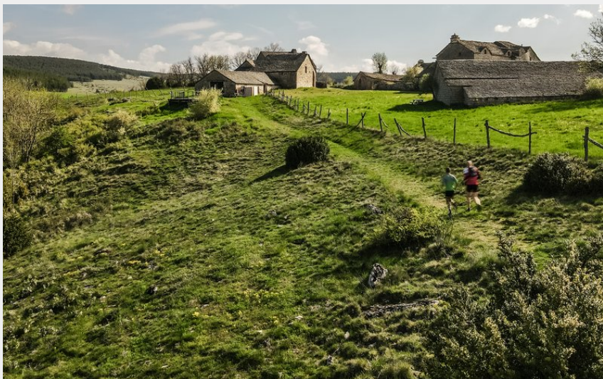
Boissets vu de loin et coureurs (@DESMIERS)