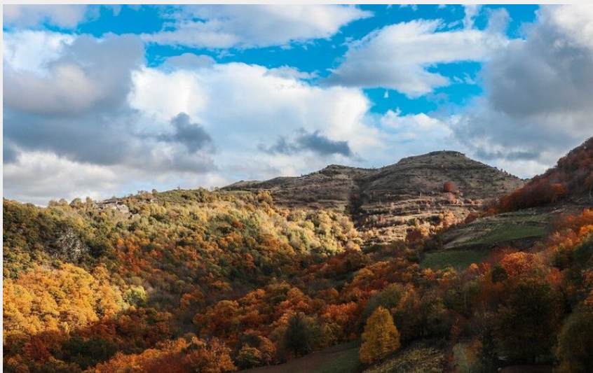
l'automne dans les Cévennes (de beaux lents demain)