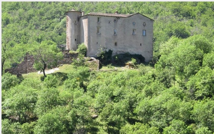
Le château du Poujol (Béatrice Galzin)