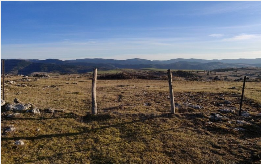
Lanuéjols (Béatrice Galzin)