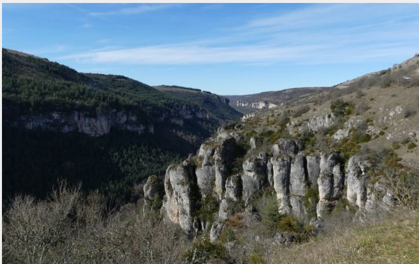
Vallée de la Jonte (N Thomas)