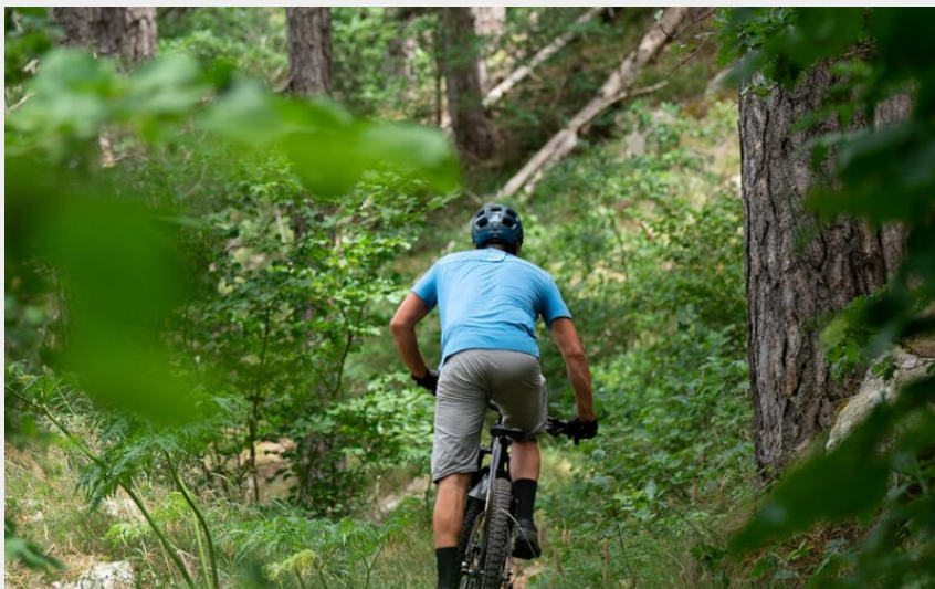
(SMAML PPN Antonin Michaud Soret Ahstudio)