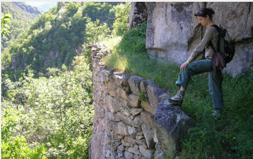
(Office de tourisme Mont Lozère)