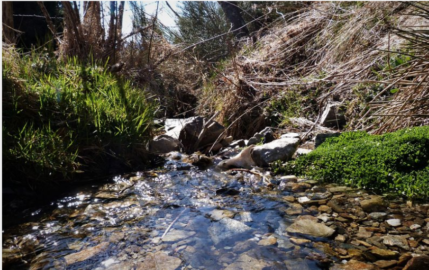
Sentier des sources du Lot