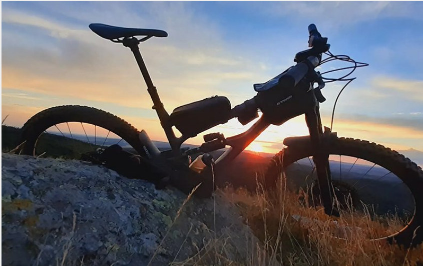
(Yannick CC Mont Lozère)