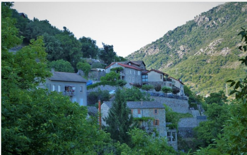
(OT Mont Lozère)