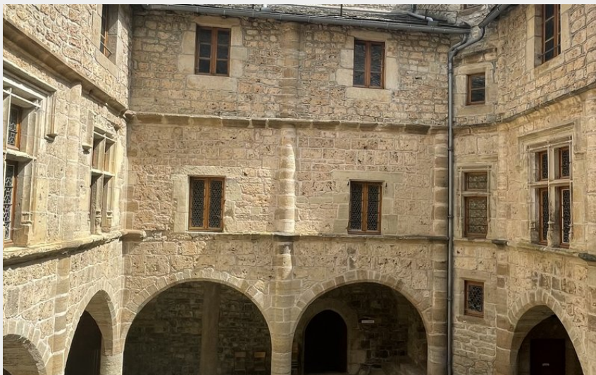
Château du Boy (OT Mont-Lozère)