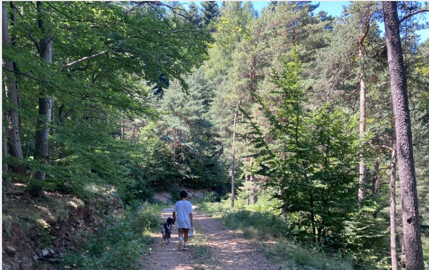
Enfant sur le sentier du mas de l'Ayre