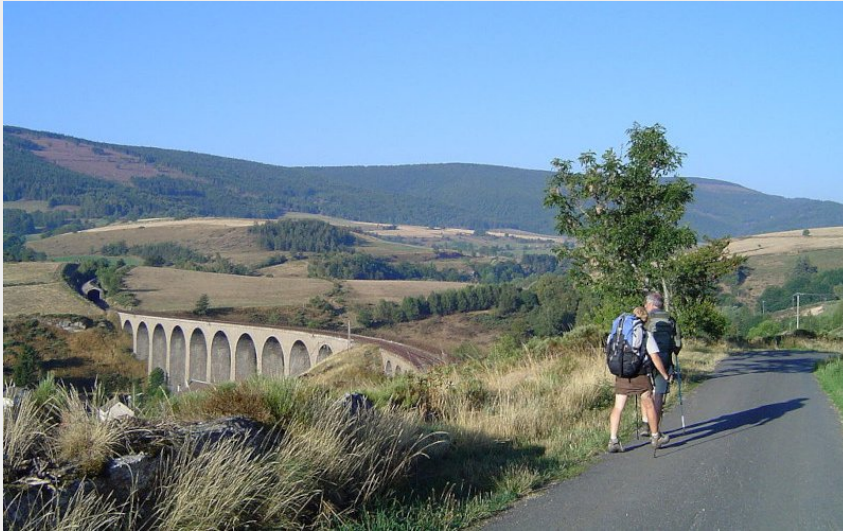
Viaduc de Mirandol, Chasseradès