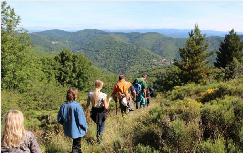
(Gîtes le Frontal Haut)