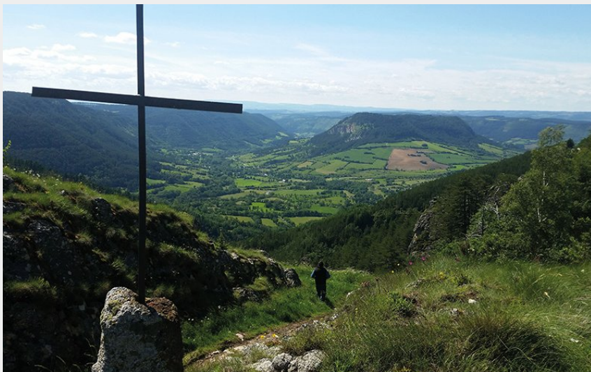
Truc de Balduc