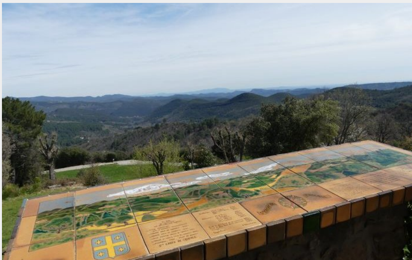
Sainte-Croix de Caderle (N Thomas)