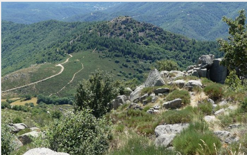
Vue sur le Chastelas (N Thomas)