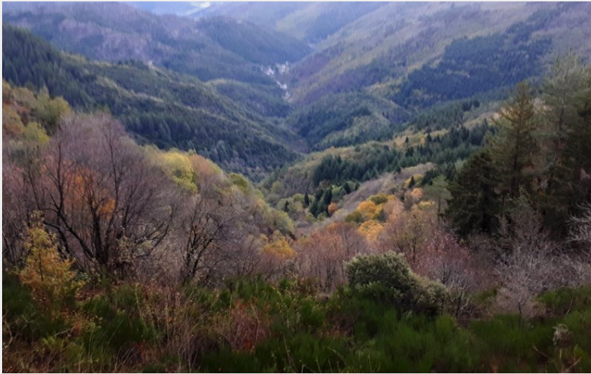
Aire de Côte descente sur la Vallée Borgne (Béatrice Galzin)