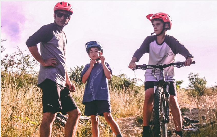
vtt famille