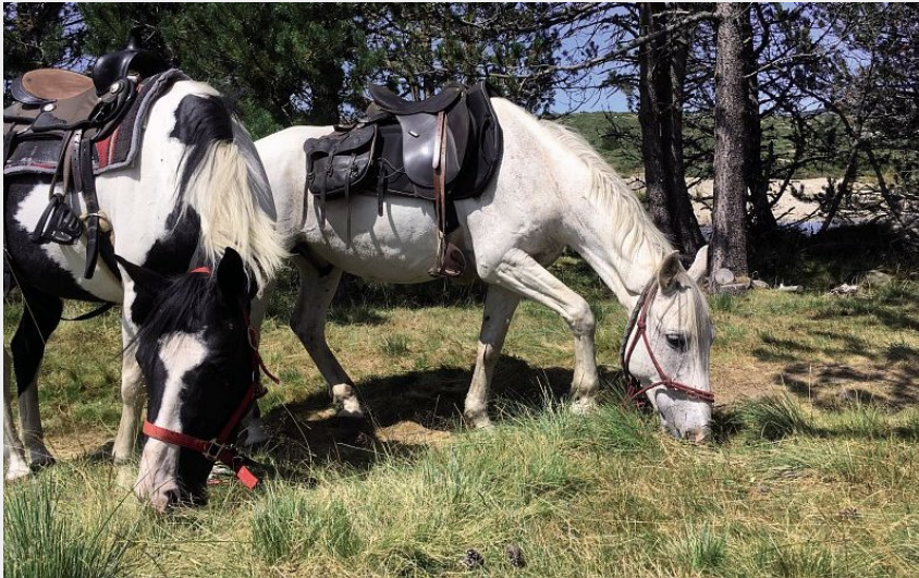
Pont du Tarn (Laurence DAYET)