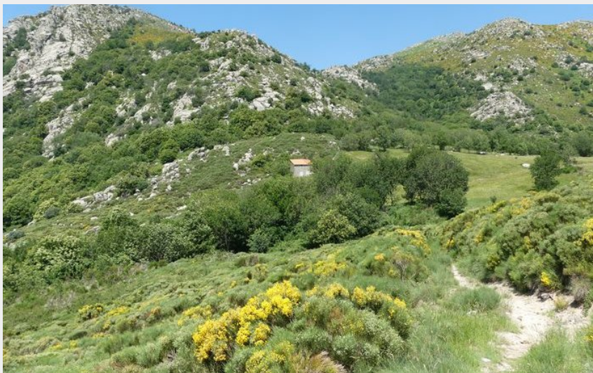
Col de Montclar (N Thomas)