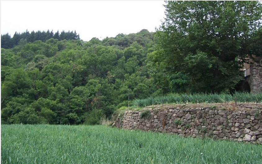
Culture Oignons Doux