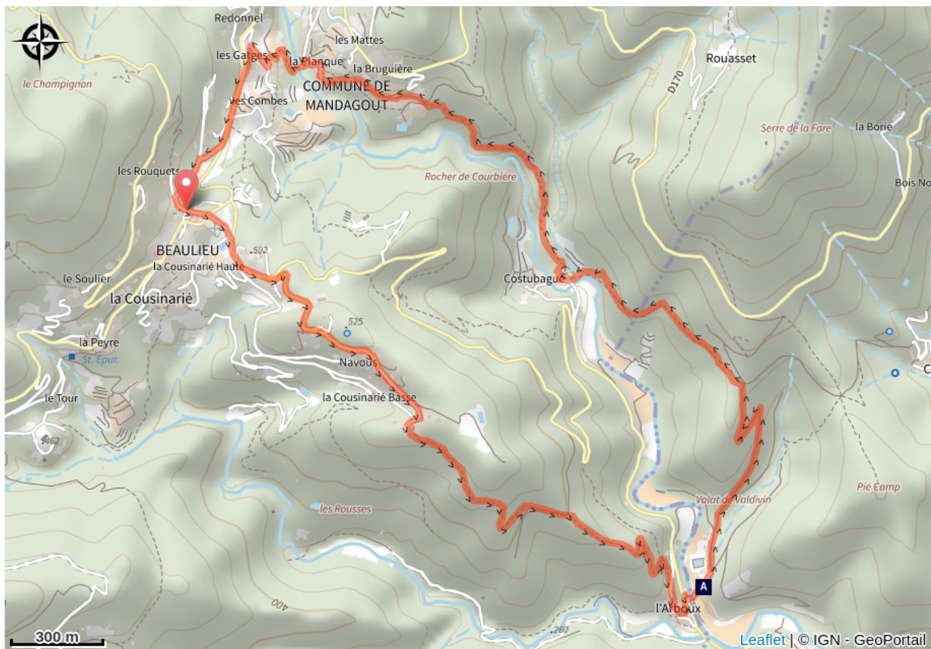
La reinette et l'oignon doux (A)