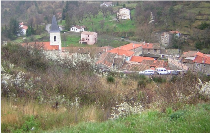
Le Chemin du Moulin