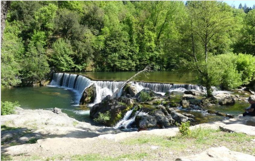
L'Arre (N Thomas)