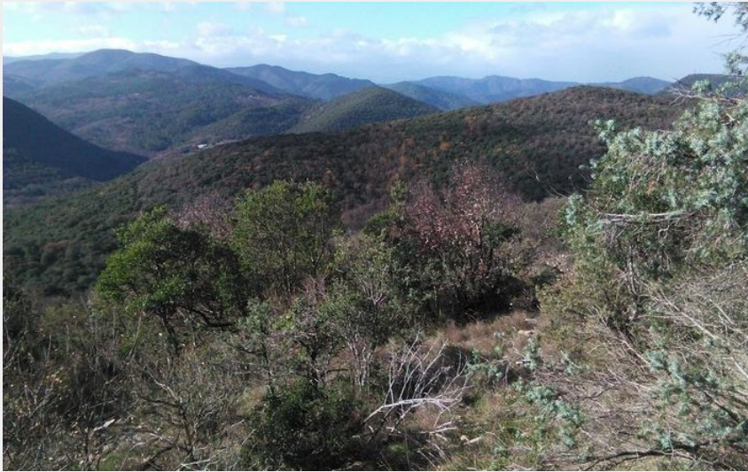
Vue sur les Cévennes (Nathalie Thomas)