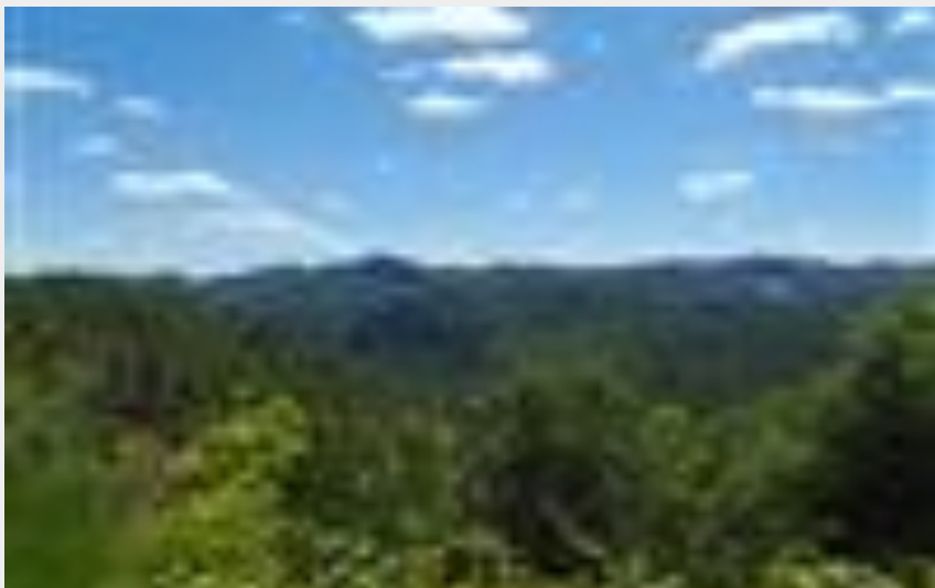
(Office de Tourisme Cévennes Gorges du Tarn)