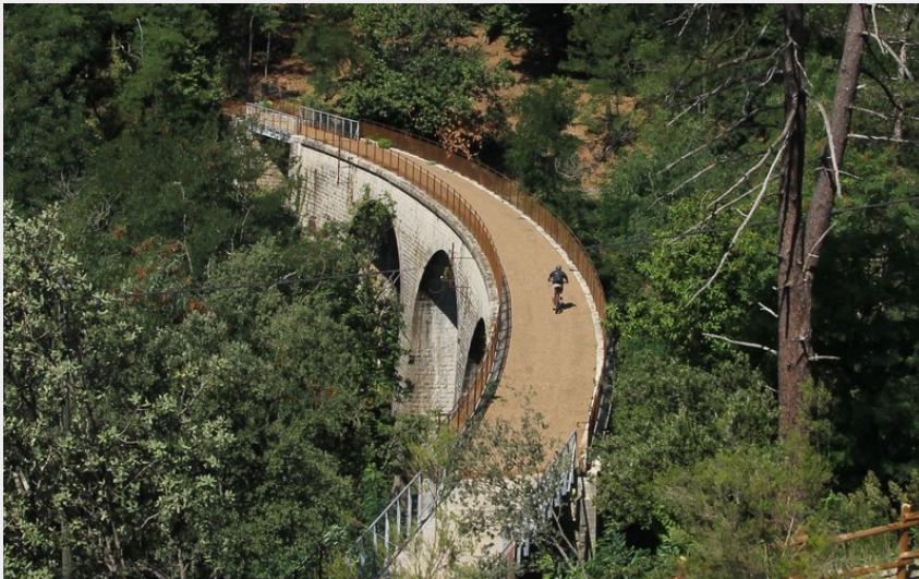
La Cévenole