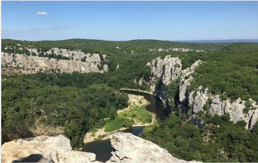
Corniche du Chassezac (SPL Cévennes d'Ardèche)