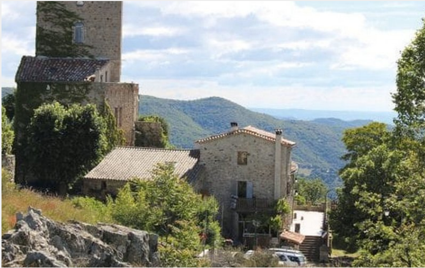
Col de la pierre plantée