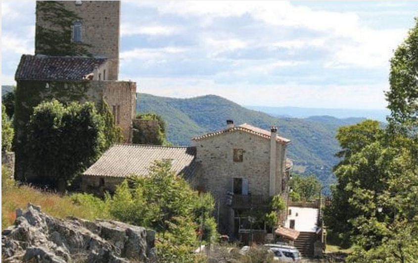
Col de la pierre plantée