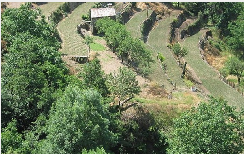
La croix de Bassel