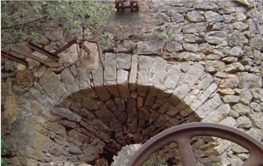
Le Col de l'Agas