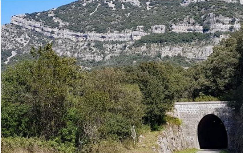
le chemin du Ranc de Banes