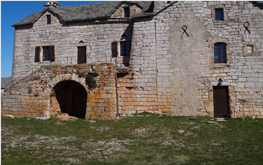
Domaine de Boissets