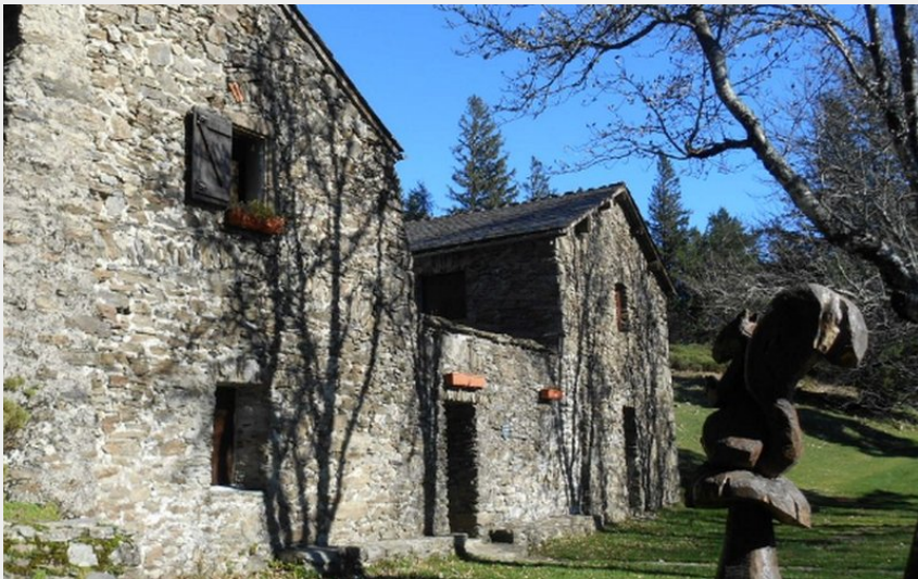
Gîte de cap de côte