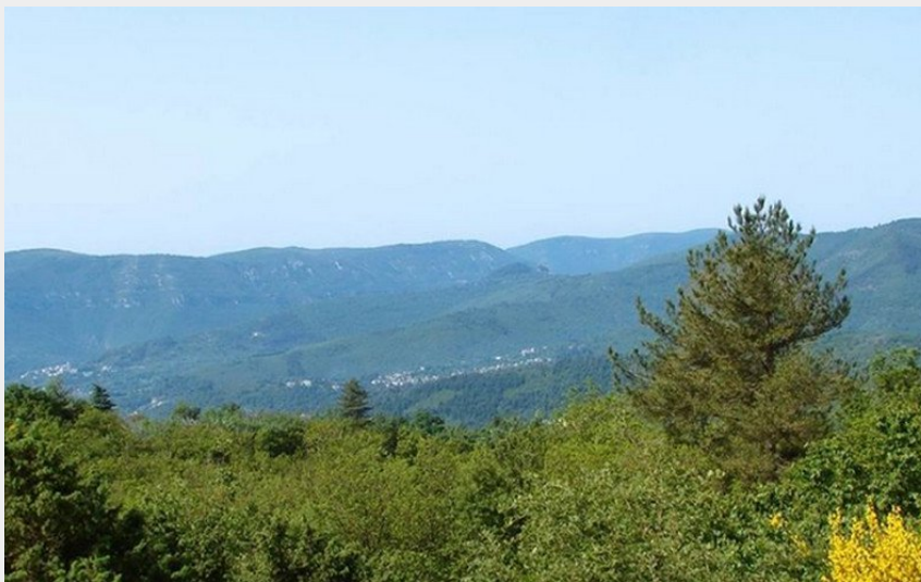
Vers le col des Mourèzes