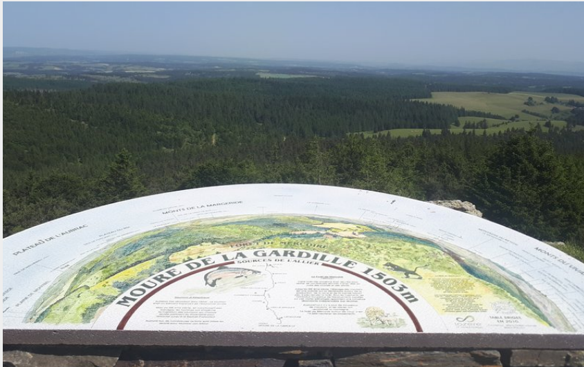
Table d'orientation du Moure de la Gardille, sommet de Lozère (TouN)