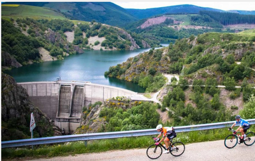
Boucle cyclo du Goulet aux barrages