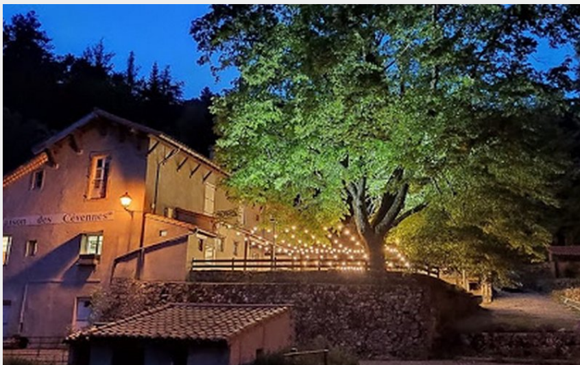
Maison des cévennes