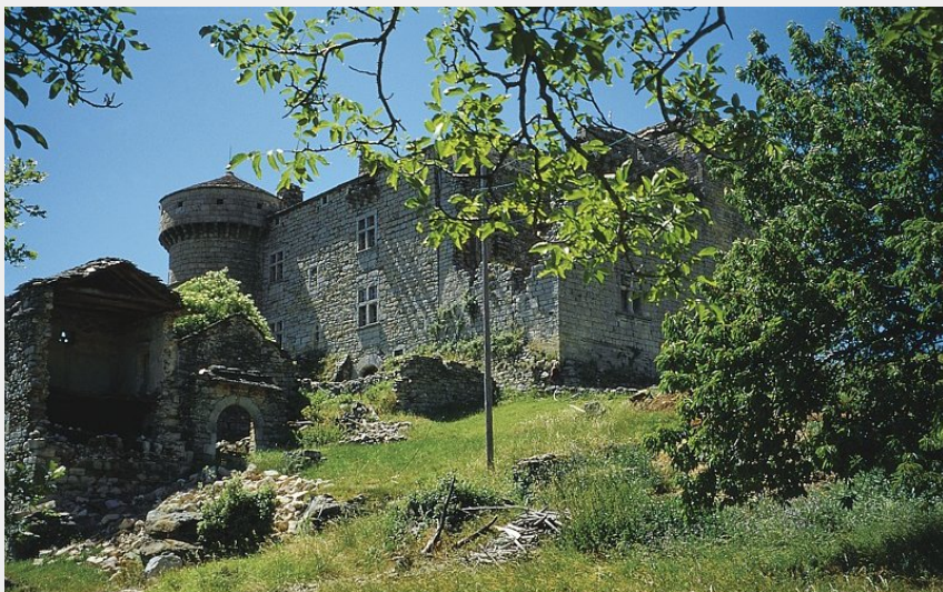
Château du Cheylard (Rémi Noël)