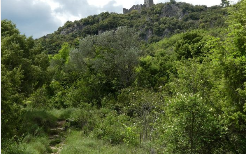
Vue sur le château (N Thomas)