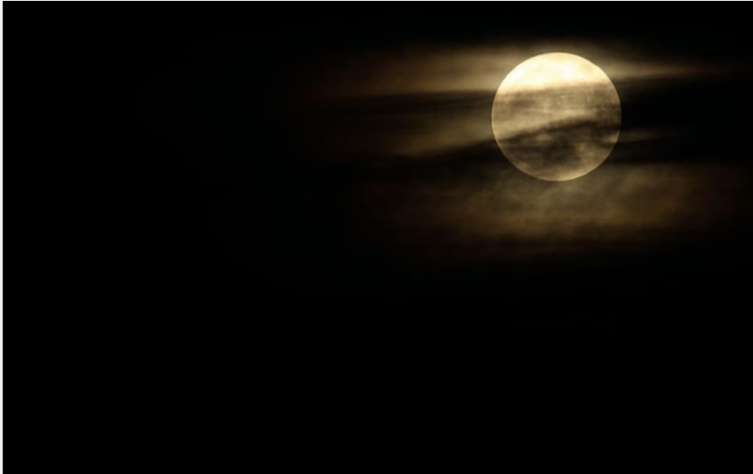
Lever de lune (B Descaves)